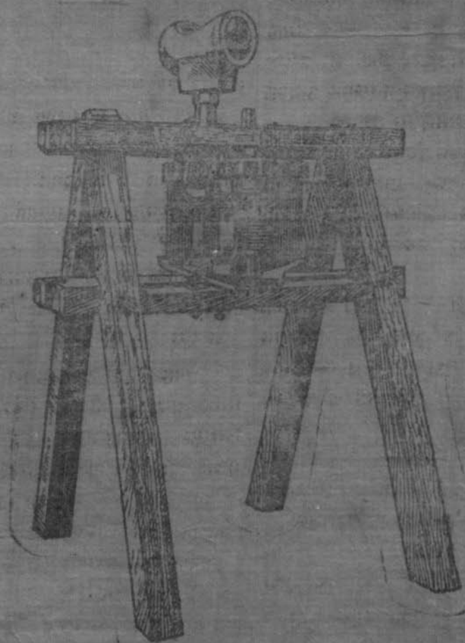
ଏହାର ମୂଲ୍ୟ ଟ ୧୨୫ ରୁ ଟ ୧୫୦ ମଧ୍ୟ ଟ ୧୭୫ ଯାଏ ।

ମହତ୍ତ୍ୱପୂର୍ଣ୍ଣ ଉଦ୍ଦେଶ୍ୟରେ ଏହାର ଉଚ୍ଚତମ କୌଶଳର ପ୍ରୟୋଗ କରାଯାଇ ପାରେ ।