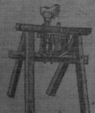
ଏହାର ମୂଲ୍ୟ ଟ ୪୫ ରୁ ଟ ୬୦ ମଧ୍ୟ ଟ ୭୫ ଯାଏ ।