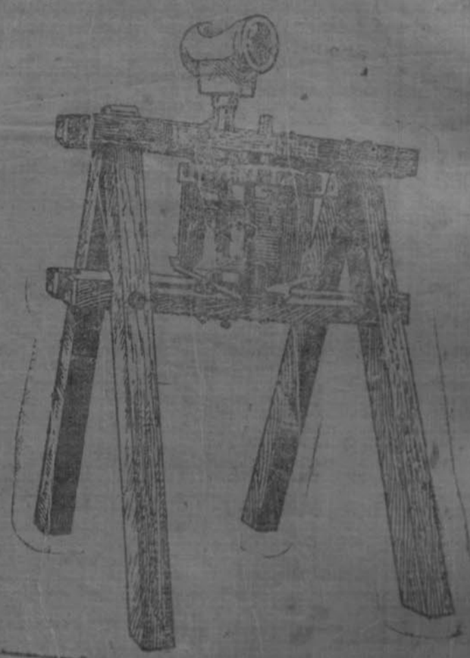
ଉତ୍କଳ ଅପରରେ ଉତ୍କଳ ଅପର ପୁସ୍ତକମାନଙ୍କୁ ପ୍ରଦାନ କରାଯାଇଛି ।

ମନୋହରୀ ଉତ୍କଳ ଅପରରେ ଉତ୍କଳ ଅପର ପୁସ୍ତକମାନଙ୍କୁ ପ୍ରଦାନ କରାଯାଇଛି ।